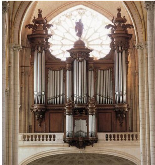
Grand orgue historique François-Henri Clicquot de la Cathédrale Saint-Pierre